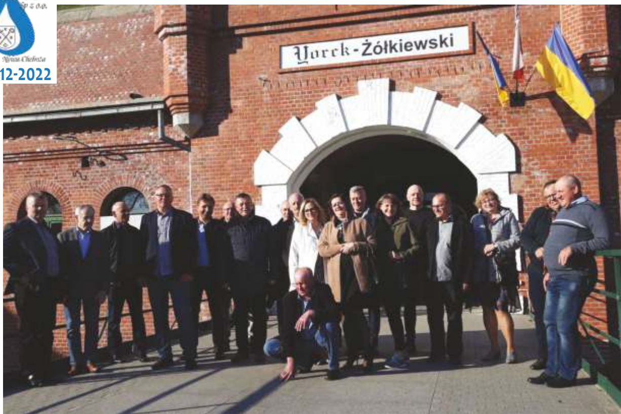
Członkowie Rady Nadzorczej, kierownictwo, pracownicy administracyjni i terenowi ZUK WODKAN sp. z o.o. oraz goście podczas wyjazdowego spotkania z okazji 10-lecia działalności Spółki. Toruń FORT IV, 23.04.2022'