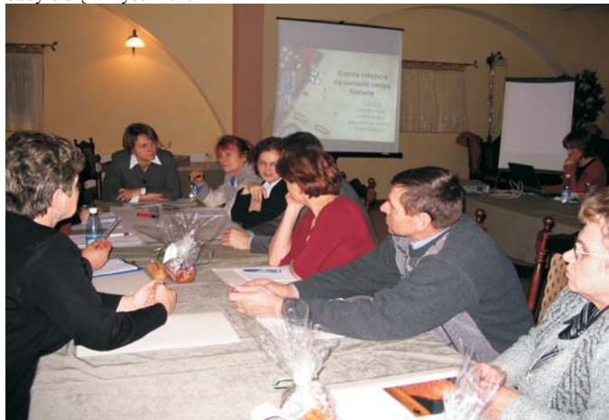
Dominującą formą pracy są zajęcia warsztatowe, na których rodzi się wiele ciekawych pomysłów

W grudniu ubiegłego roku rozpoczęła się realizacja projektu „Ziemia Gotyku” na obszarze czterech gmin: Chełmża, Łubianka, Łysomice i Papowo Biskupie. Projekt współfinansowany jest ze środków Unii Europejskiej w ramach pilotażowego programu LEADER+ w schemacie I Sektorowego Programu Operacyjnego „Restrukturyzacja i modernizacja sektora żywnościowego oraz rozwój obszarów wiejskich 2004-2006”.