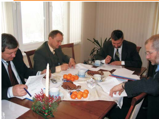
Wójtowie czterech gmin zaangażowanych w realizację LEADER+ wypracowali koncepcję współpracy