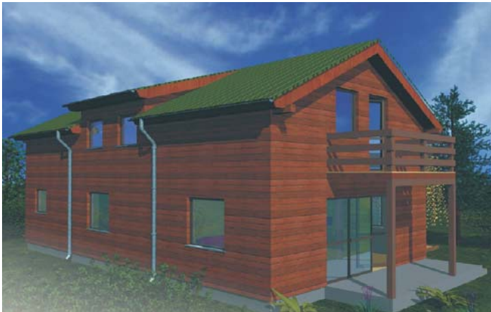
Faza III - ostatnia budowy domku, powierzchnia 120m 2