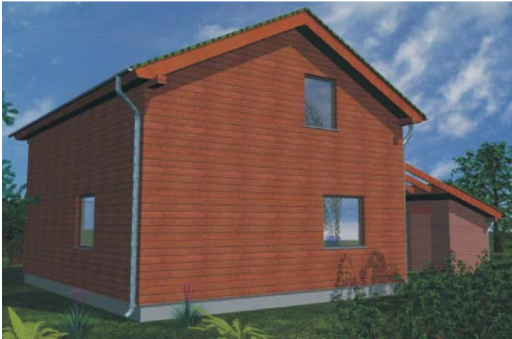
Faza I budowy domu, powierzchnia 44m 2

Obok osiedla ma powstać także budynek komunalno - socjalny dla pięciu rodzin.