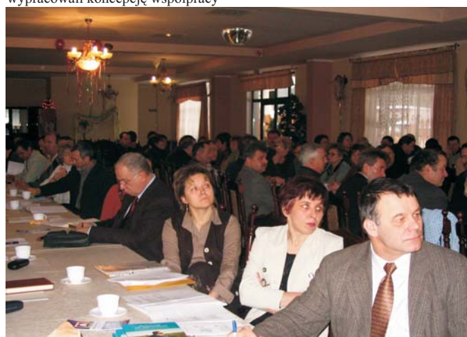
Spotkanie osób deklarujących aktywny udział w projekcie Ziemia Gotyku odbyło się w Łysomicach

ZIEMIA GOTYKU Fundacja - Lokalna Grupa Działania GMINY CHEŁMŻA, ŁUBIANKA, ŁYSOMICIE, PAPOWO BISKUPIE