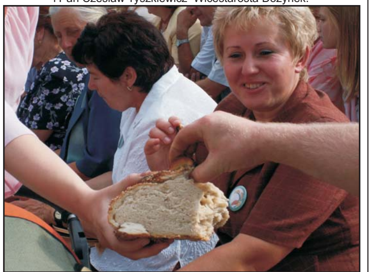
Tradycyjnie do wspólnego podziału chleba w Gminie Chelmża Wójt zaprosił przybyłych gości i wybranych mieszkańców gminy.