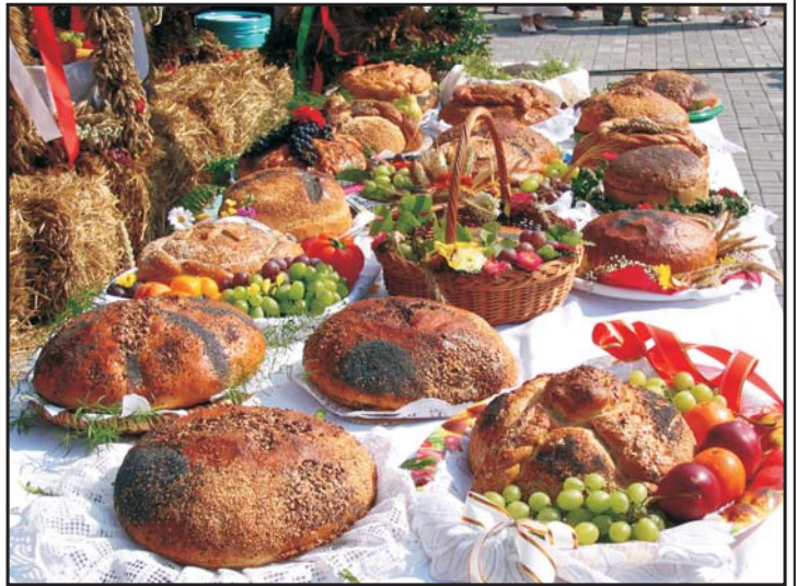
Mieszkańcy przybyłych sołectw przygotowali wieńce dożynkowe będące symbolem plonów i ukoronowaniem całorocznej pracy rolnika oraz wspaniale wypieczone chleby - symbole dostatku.