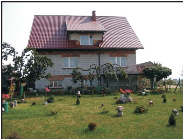
III miejsce Wiesława i Wiesław Skoczek z Kuczwał