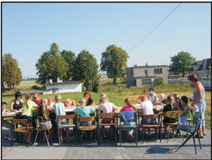
Tekst i fot. E.Czarnecka

Dziękuję serdecznie osobom, które częstowały obiadami gości-wolontariuszy, tym które pomagały w realizacji zajęć i pracach organizacyjnych na terenie swoich wsi. Dzięki środkom finansowym przekazanych przez rady sołeckie Kończewic i Bielczyn, dzieci przeżyły wiele radosnych chwil.