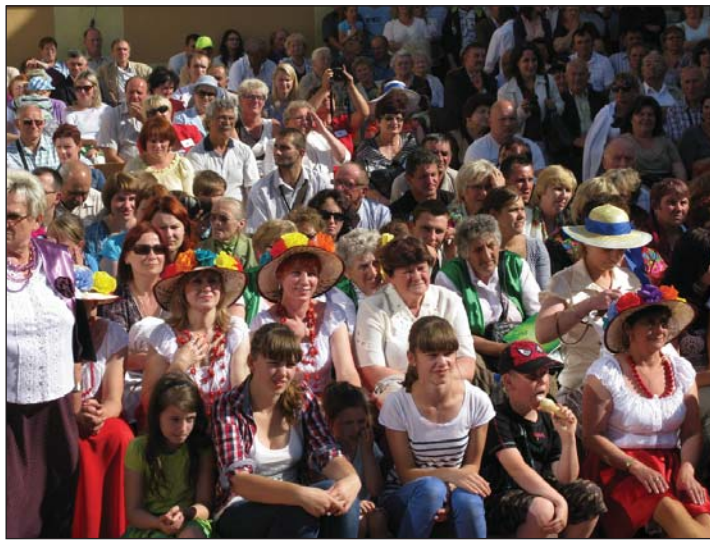
Święto Kół Gospodyń Wiejskich w Zelgnie zgromadziło szerokie grono uczestników.