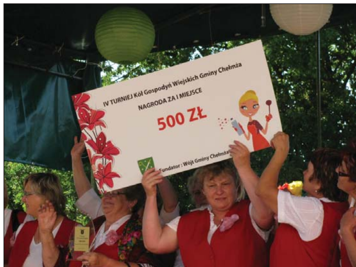
Laureatka IV turnieju Kół Gospodyń Wiejskich Gminy Chełmża została KGW Brąchnówko.