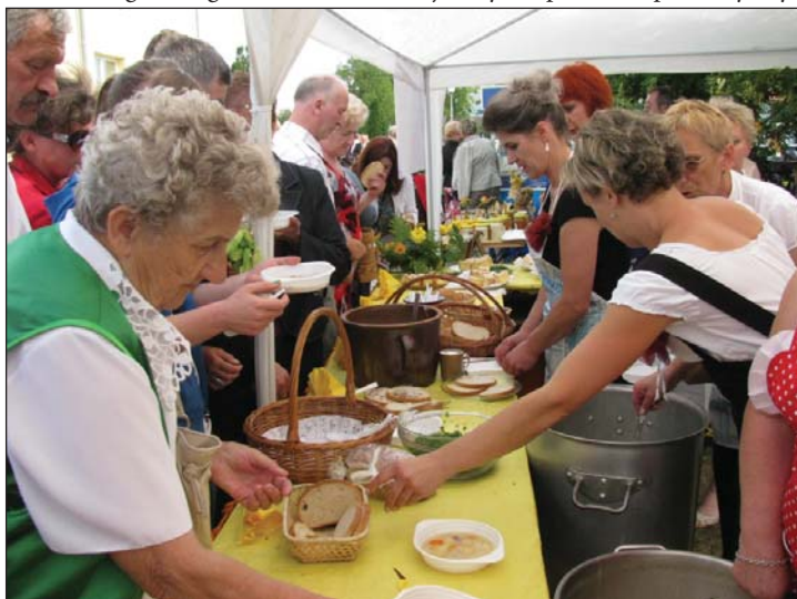
Panie z KGW Zelgno serwowały poczęstunek w ramach projektu „Staropolska eko-kuchnia” realizowanego przez Stowarzyszenie Homo homini.