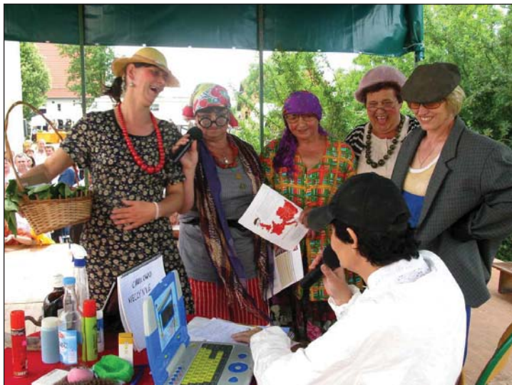
Panie z KGW w Kuczwałach wystąpiły w scenie kabaretowej pod nazwą „W kolejce”.