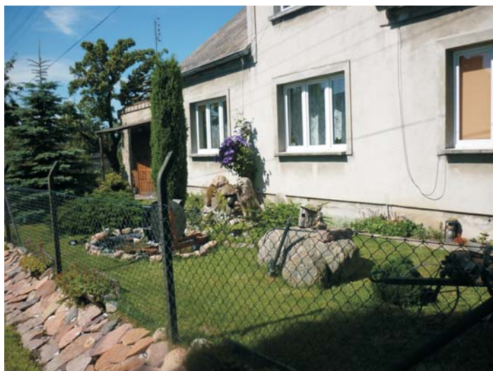
Działka p.Z.Stojalowskiego z Liznowa - III miejsce w konkursie