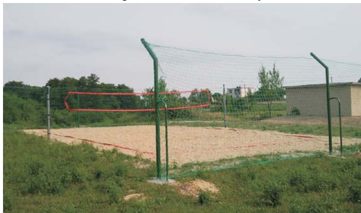
Miejsce rekreacji i wypoczynku w Pluskowęsach

Mieszkańcy Skąpego mogą korzystać z placu rekreacji, który wyposażony został w zestaw sprzętu do ćwiczeń na świeżym powietrzu. To pierwszy taki i na razie jedyny sprzęt w gminie, który cieszy się sporym zainteresowaniem, szczególnie wśród dzieci i młodzieży.