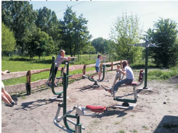
Skąpe: zewnętrzna siłownia

Budowę tego miejsca rekreacji i wypoczynku sfinansował w kwocie 13.333 zł samorząd województwa, a całkowity jego koszt wyniósł 21.203 zł, z czego resztę dołożył samorząd gminny.