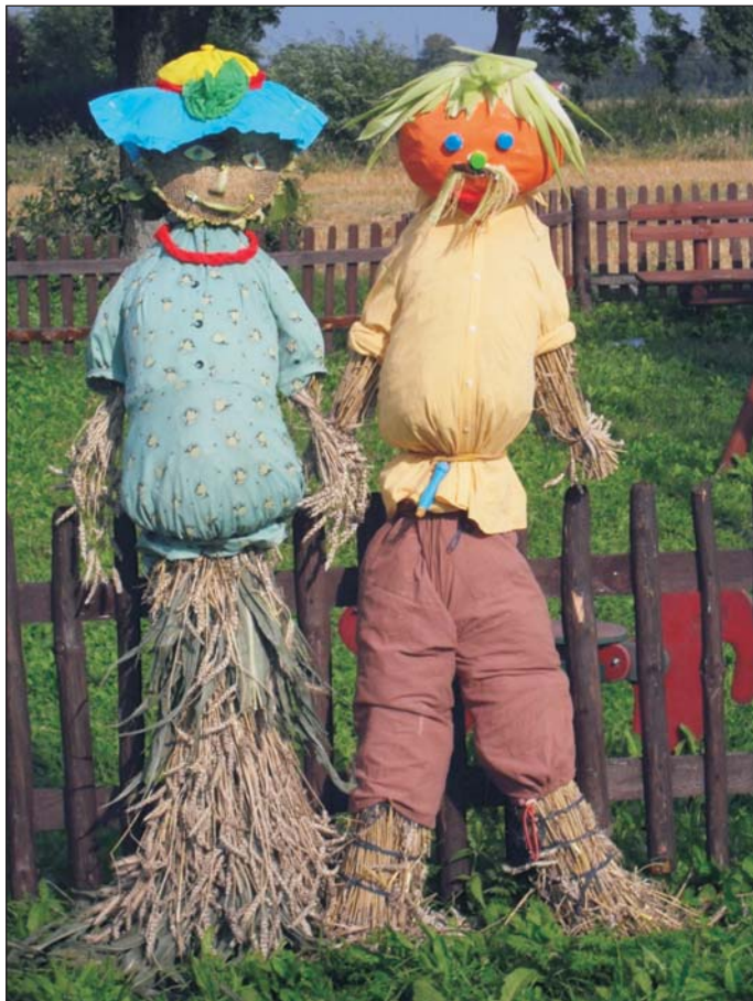
Żniwna ozdoba przy świetlicy w Mirakowie - I miejsce w konkursie pn. „Pantienka żniwna i chłop żniwny” zorganizowanym przez CIK Gminy Chełmża.