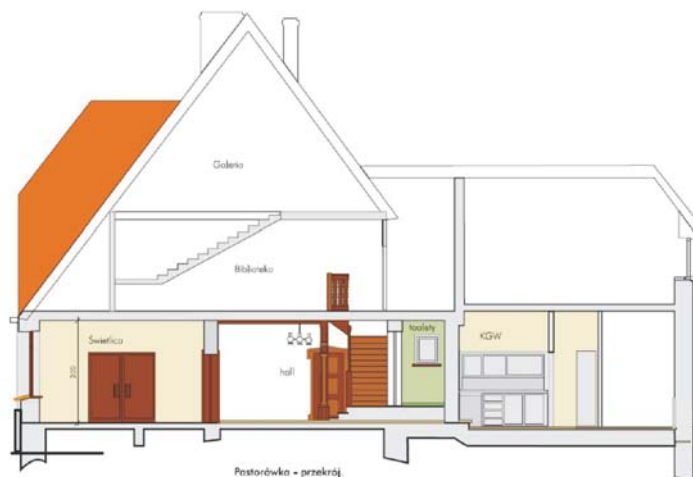
Przekrój adoptowanego obecnie budynku Pastorówki w Zelgnie.

Budynek powoli zmienia swój wygląd zewnętrzny. Wymieniona została stolarka okienna, a mury pokryje nowa elewacja.