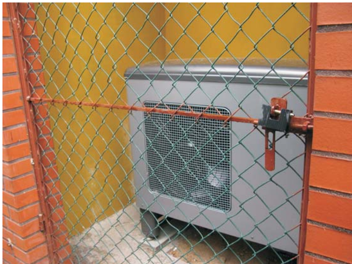
Pompa ciepła zainstalowana przy SP w Zelgnie

Modernizacja kotłowni w gimnazjach i w SPOZ w Zelgnie to inwestycja realizowana w ramach projektu „Budowa instalacji solarnych i pomp ciepła w Gimnazjum w Głuchowie i w Gimnazjum w Pluskowęsach oraz Samodzielnym Publicznym Ośrodku Zdrowia w Zelgnie”, do którego dofinansowanie gmina ubiega się ze środków unijnych w ramach Programu Rozwoju Obszarów Wiejskich na lata 2007-2013.