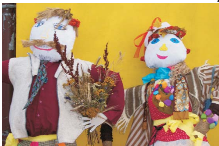
Bielczyny - III miejsce w konkursie

W/w konkurs na dekoracje wiejskie ogłoszony został przez CIK Gminy Chełmża dla uczestników zajęć prowadzonych w ramach programu „Fabryka Marzeń” realizowanego podczas wakacji przy świetlicach wiejskich.