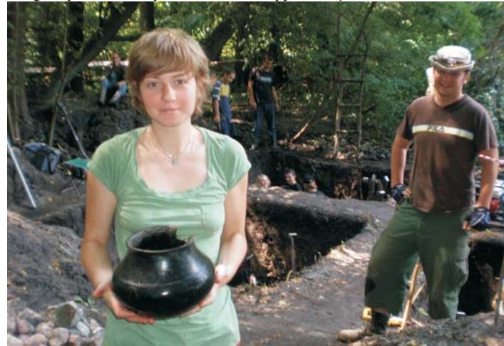
Znalezione naczynie - amfora, przełom epoki brązu i żelaza.

Działania dotyczyły zbadania przeprawy mostowej, która łączyła wyspę z brzegiem jeziora. Odkryto m.in. konstrukcję mostu, pale i belki.