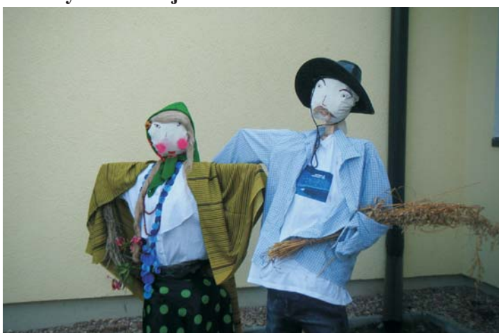
Zajączkowo - III miejsce w konkursie

Natomiast wzorem lat ubiegłych mieszkańcy gminy mogą wziąć udział w kolejnym, podobnym konkursie, ale tym razem na baby ze słomy, którego organizatorem jest również CIK. (patrz str.11).