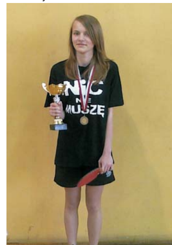
Wicemistrz Powiatu Toruńskiego w tenisie stołowym dziewcząt - Gimnazjum w Głuchowie