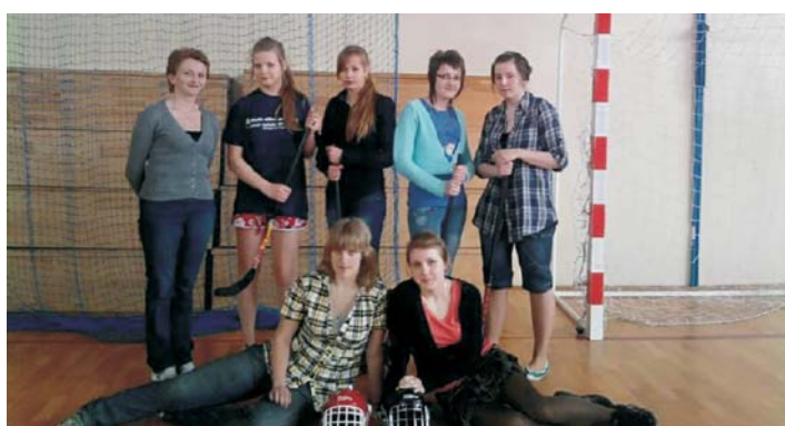
Wicemistrz Powiatu Toruńskiego w unihok dziewczyn - Gimnazjum w Pluskowęsach