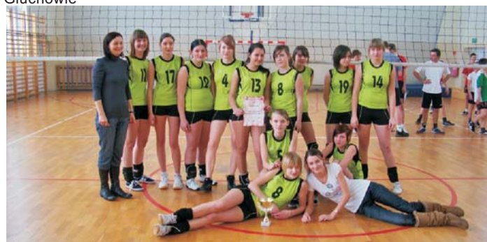
Wicemistrz Powiatu Toruńskiego w siatkówce dziewczyn - Gimnazjum w Głuchowie