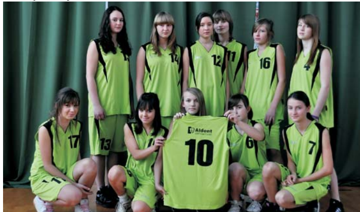
Mistrz Powiatu Toruńskiego w koszykówce dziewczyn - Gimnazjum w Głuchowie

ZBLIŻA SIĘ KONIEC ROKU SZKOLNEGO ZARÓWNO W WYMIARZE EDUKACYJNYM JAK I SPORTOWYM. MINIONY ROK UPŁYNAŁ POD ZNAKIEM WIELU ZNACZĄCYCH SUKCESÓW SPORTOWYCH UCZNIÓW GMINY CHEŁMŻA. ZAPEWNE WYNIKI NASZYCH SPORTOWCÓW TO PRZED WSZYSTKIM EFEKT WSPÓŁPRACY UCZNIÓW Z OPIEKUNAMI. NIE SPOŚÓB JEDNAK POMINAĆ W TYM ŁAŃCUCHU OGNIW, KTÓRYMI SĄ DYREKTORZY SZKÓŁ ORAZ ORGAN PROWADZĄCY NASZE PLACÓWKI. CI PIERWSI CZĘSTO ROZWIĄZYWALI PROBLEMY ORGANIZACYJNE ZWIĄZANE Z LICZNYMI WYJAZDAMI NA ZAWODY, CI DRUDZY ZABEZPIECZAJĄ SPORT DZIECI OD STRONY FINANSOWEJ. NIECH FORMĄ PODZIĘKOWANIA DLA WSZYSTKICH BĘDZIE GALERIA TYCH, KTÓRZY NAJLEPIEJ PROMUJĄ NASZĄ GMINĘ.