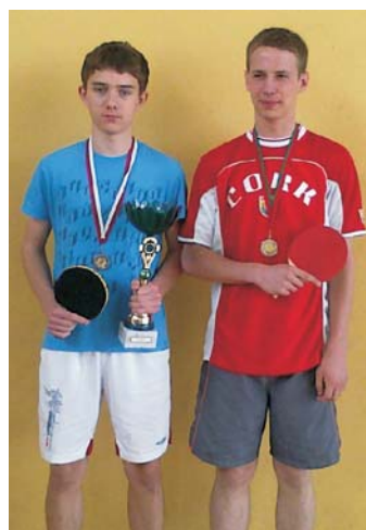
Mistrz Powiatu Toruńskiego w tenisie stołowym chłopców - Gimnazjum w Głuchowie