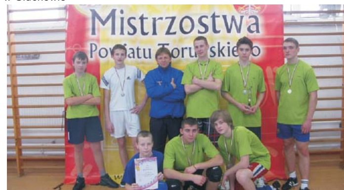
Wicemistrz Powiatu Toruńskiego w siatkówce chłopców - Gimnazjum w Głuchowie