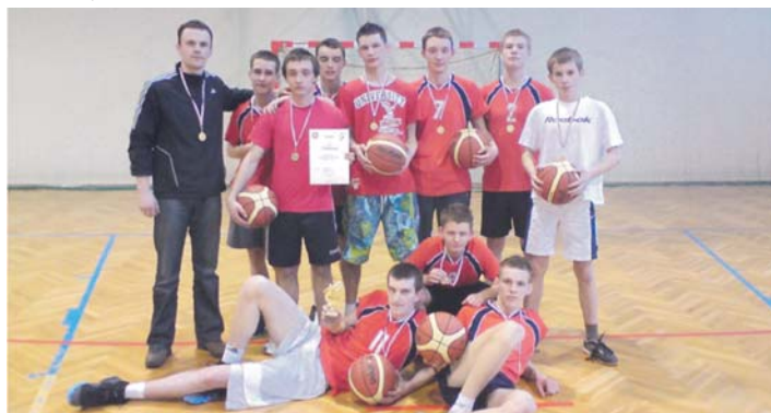
Mistrz Powiatu Toruńskiego w koszykówce chłopców - Gimnazjum w Pluskowęsach