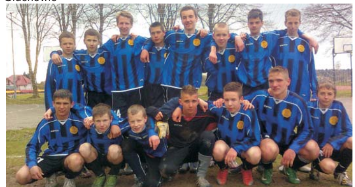
III miejsce w Mistrzostwach Powiatu Toruńskiego w piłce nożnej chłopców - Gimnazjum w Głuchowie