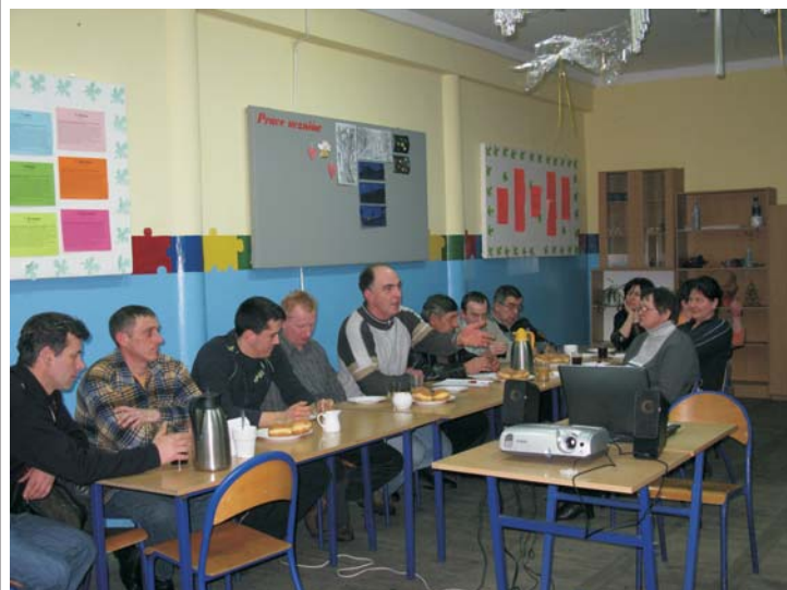
Mieszkańcy Gluchowa podczas zebrania wiejskiego.

W Gminie Chełmża z dniem 1 lutego br. rozpoczęły się zebrania wiejskie, które odbędą się na terenie 28 sołectw w gminie. Spotkania przedstawicieli władz samorządowych z mieszkańcami zakończą się około połowy marca. Cykl wspomnianych corocznych spotkań rozpoczęło zebranie wiejskie w Kończewicach, a zakończy zebranie z mieszkańcami w Dziemionach.