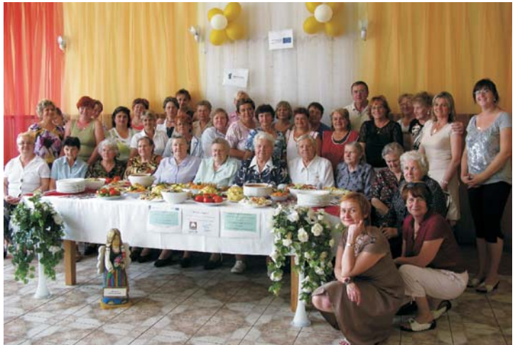
Uczestnicy „Wiejskiej szkoły zdrowia” w Kuczwałach.

W miesiącach wrzesień-październik br. planowana jest kontynuacja warsztatów dla trzech kolejnych grup w miejscowościach Głuchowo, Zelgno i Kuczwały. Dokładne terminy zajęć zostaną ustalone i podane do wiadomości jeszcze w sierpniu. Osoby zainteresowane udziałem w warsztatach mogą zapisywać się telefonicznie u koordynatora projektu pod nr tel. 6098073 16 lub pod nr 056 675 60 76 w UG Chełmża, pok. nr 16.