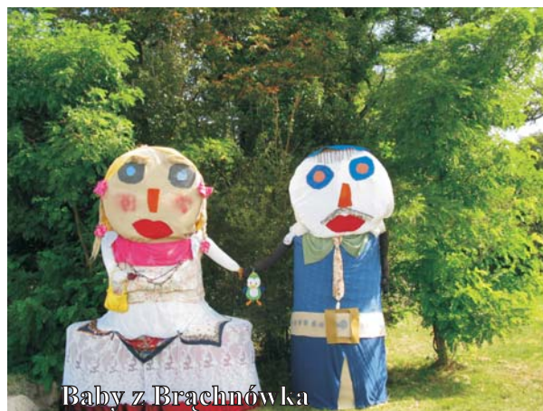
Baby z Brachnówka